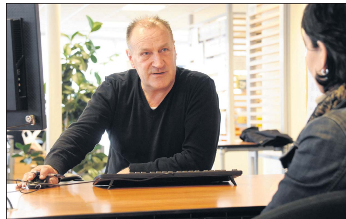
Het gebouw van de afdeling WIZ in Venlo. Onder: een werkcoach in gesprek met een cliënt.