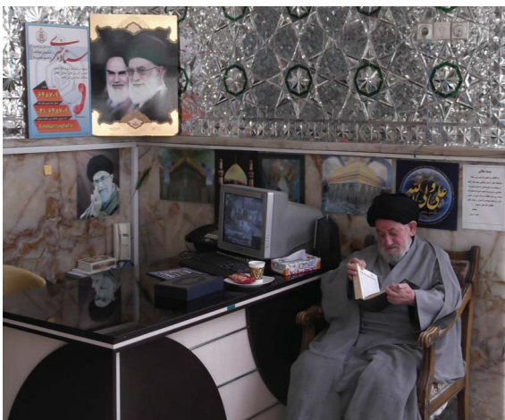
Een ayatollah leest de koran in een moskee in Teheran.

zandstenen straatjes van het middeleeuwse Yazd, waar hoge ventilatieschachten op de bolle daken enige verkoeling brengen in de blikkerend hete zomers. We rijden door de Dasht-e Kavir , de onmetelijk grote, kurkdroge woestijn ten noorden van deze stad - in deze regio zijn temperaturen van 70 graden Celsius gemeten. Kuddes dromedarissen sukkelten langs de zandduinen en kijken ons loom herkauwend aan. In de verte doemen de contouren op van de herbovde caravanseraï , een kasteelachtige herberg waar vroeger de karavanen halt hielden. Op de binnenplaats viert een uitbundige groep jongens een schoolreisje. Hun begeleiders grillen kipebabas en brengen ons ook een rijke portie. In Shiraz betreden we het grote mausoleum van de shi'itische heilige Soyyed Mir Ahmad en vallen weer om van verbazing. De met goud beklede koepels en minaretten, de honderden feëtrieke witte lampjes, het glimmende enorme marmeren plein, voor westers-christelijke ogen is het een ongekend exotisch tafereel. We nemen plaats op de rand van de vijver en luisteren gefascineerd naar de islamitische gezangen. Iraanse gezinnetjes komen in gebroken Engels vragen 'what we think of Iran'. En ik denk: hier is een onterecht onbekende, wonderlijke wereld voor me opengestaan.