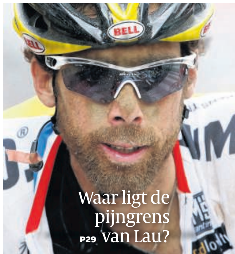
Waar ligt de pijngrens P29 van Lau?